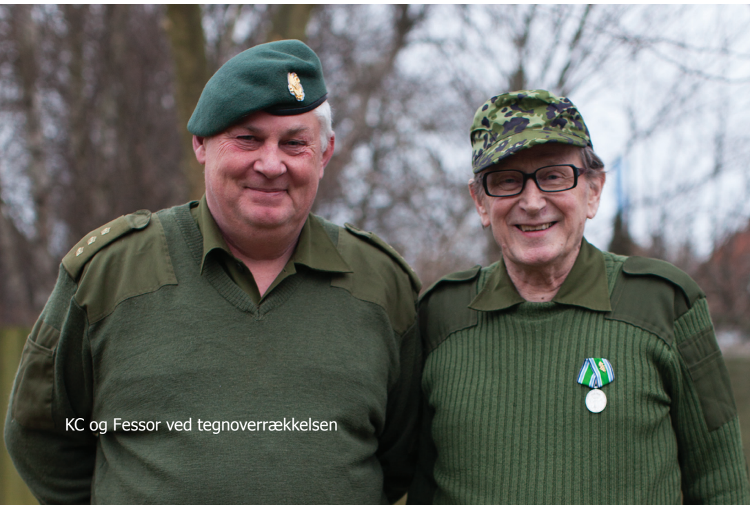
KC og Fessor ved tegnoverrækkelsen

Med hensyn til 50 års tegnet, så er der kun een ting, der ærger Fessor. Han ville gerne have modtaget det i posthjemmeværnsregi, for det er der, han har tjent i de mange år. Men bortset fra den lille detalje, så er han stolt af sin medalje - hvilket der også er al mulig grund til at være•